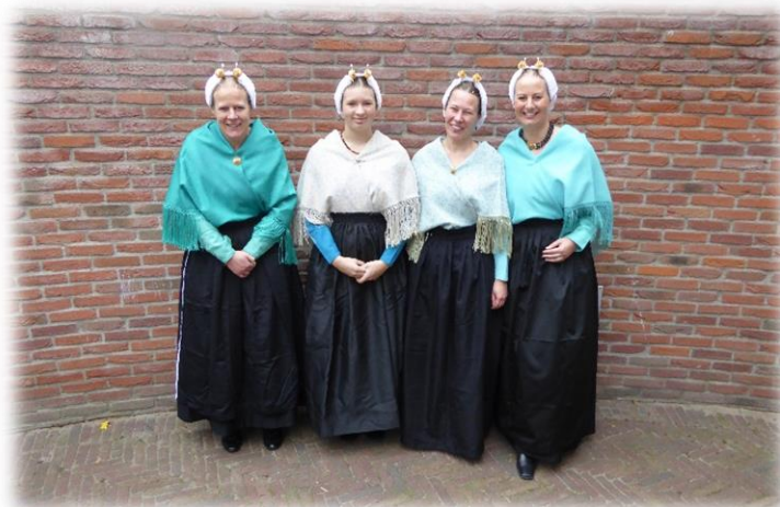
Vier dames de Niet in klederdracht ter ere van de boekpresentatie.

De eerste druk is al uitverkocht maar de 2 de druk verschijnt binnenkort.